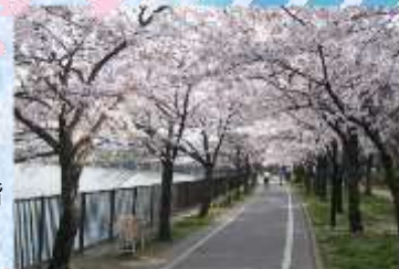
写真：左：中央大通 / 右：大川沿い

(E-mail) bicycle-workshop1@city.osaka.lg.jp