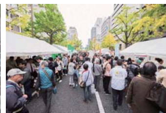
(写真) 御堂筋オータムパーティー 2016 の様子