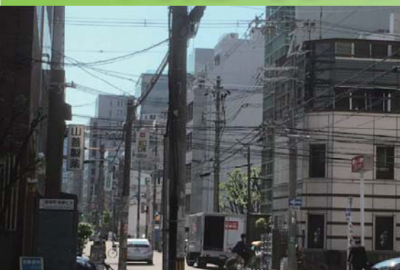
(写真) 電線が目立つまちなみ