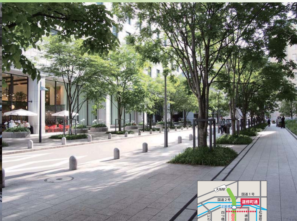
(写真) 完成した道路