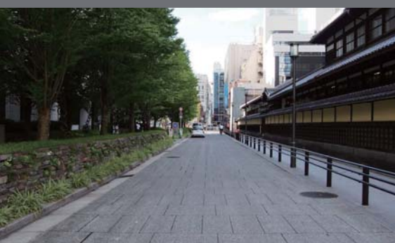
(写真) 完成した道路